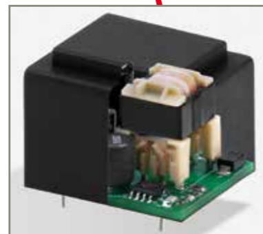
Schaltnetzteil / ErP ready! 3 W Switch-Mode-Power-Supply 3 W