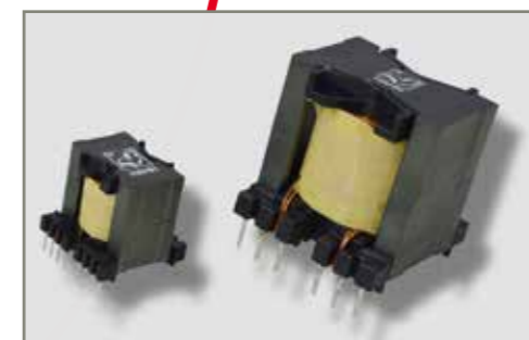
Aktive PFC-Drosselserie Active PFC-choke series