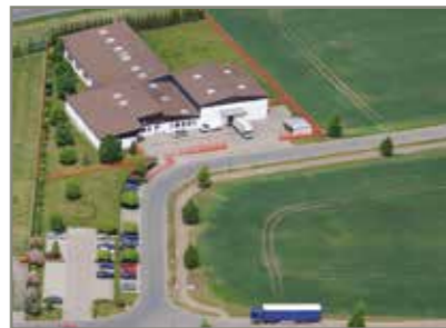
Günsten/Sachsen-Anhalt Produktion / Production