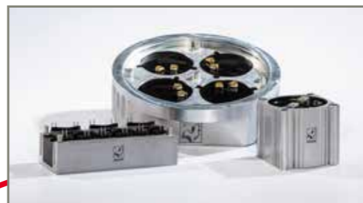
Interleaved PFC-Drosseln / Power Units Interleaved PFC-chokes / Power units