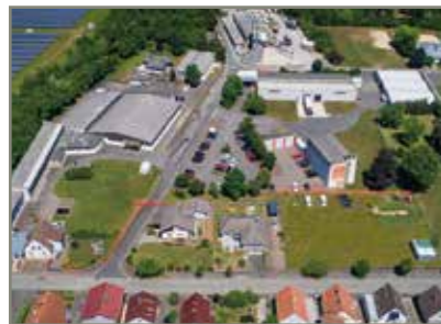
Hungen/Hessen Gründung 1949 / Foundation 1949 Hauptverwaltung / Head Office Produktion / Production

HAHN – Qualität, Leistung die Vertrauen schafft!