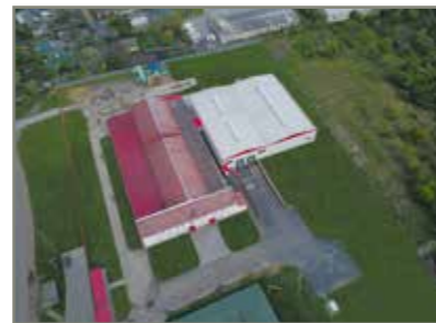
Novovolynsk (Ukraine) Produktion / Production

Roughly 600 longtime, innovative and qualified employees in three DIN ISO 9001:2015-certified plants build the base of our core-competence and the fundament of HAHN.